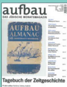
Titelseite: Dezember 2008

There are logical reasons to support aufbau with an ad. For instance, it is read with exceptional intensity and is seen as showcase reading. It also has an extremely intellectual and engaged readership with above average purchasing power. And, with its premium authors, it offers the perfect setting for presenting your products and services in the most advantageous light. Our tradition is an obligation to us. We have also created an environment for you that will do justice to your ad. Advertise in a superior publication and address a high spending target group which is both interesting and interested. Let us, hand in hand, bring tradition into the future – because they both need each other.