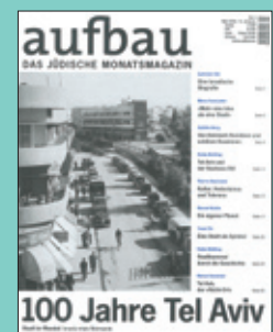
Titelseite: März 2009