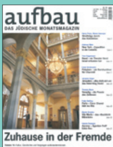
Titelseite: Juli 2007

Es gibt durchaus nachvollziehbare Gründe, den aufbau mit einer Anzeige zu unterstützen. Er wird ausserordentlich intensiv genutzt und gilt als Vorzeigelektüre. Er verfügt über eine äusserst gebildete, engagierte und überdurchschnittlich kaufkräftige Leserschaft. Und er bietet mit seinen hochkarätigen Autoren ein perfektes Umfeld, um Ihre Produkte und Dienstleistungen vorteilhaft in Szene zu setzen. Tradition verpflichtet uns. Wir haben auch für Sie ein Umfeld geschaffen, das Ihrer Anzeige gerecht wird. Inserieren Sie in einem gehobenen publizistischen Umfeld und sprechen Sie eine interessante und interessierte Zielgruppe mit starker Kaufkraft an. Lassen Sie uns Hand in Hand Tradition in die Zukunft tragen – denn sie braucht Sie.