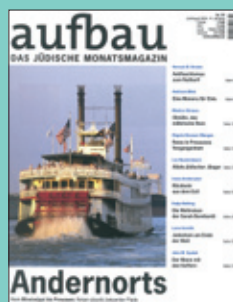
Titelseite: August 2008