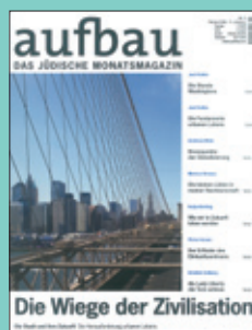
Titelseite: Februar 2009