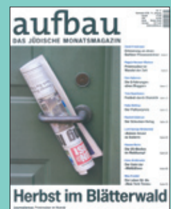
Titelseite: November 2008